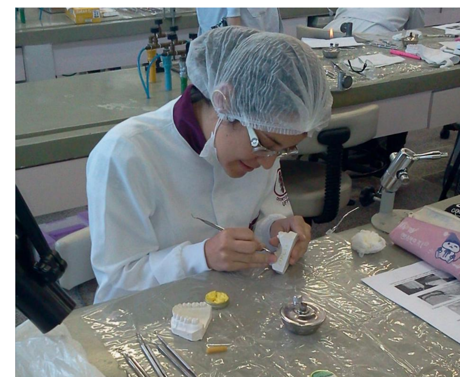
Figura 3. Oficina de Cera