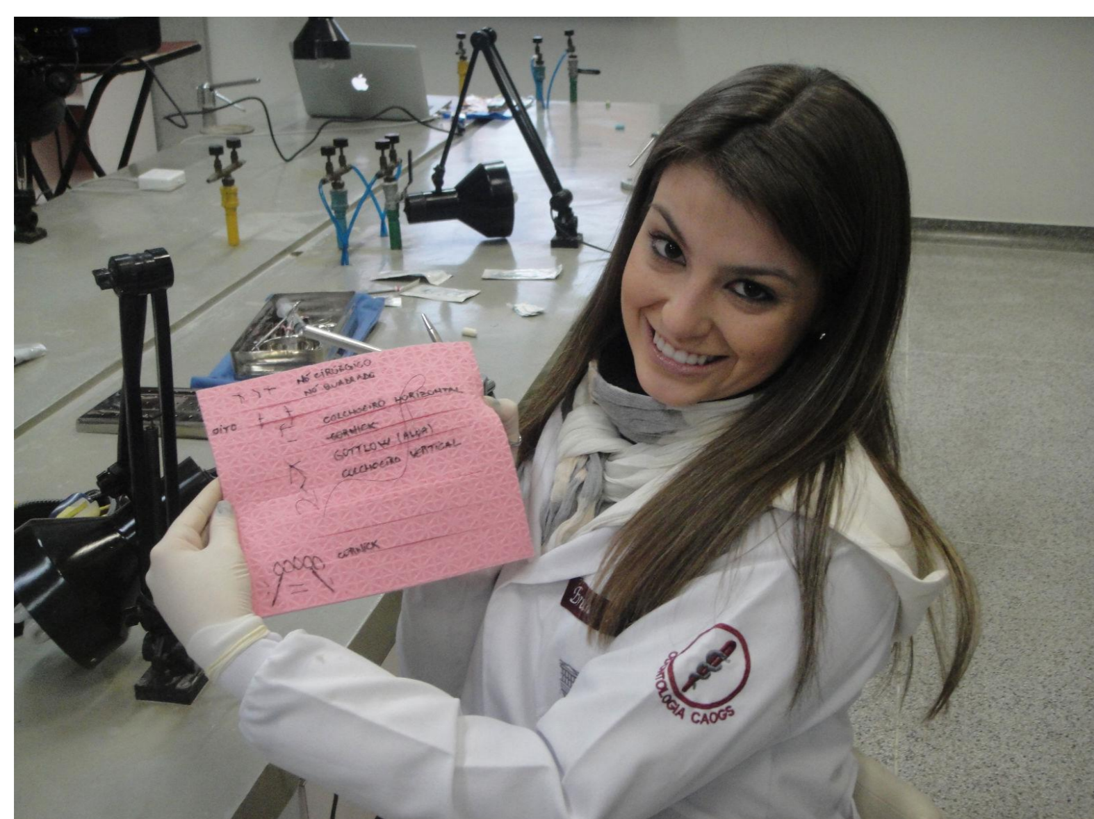
Figura 1. Oficina de Sutura