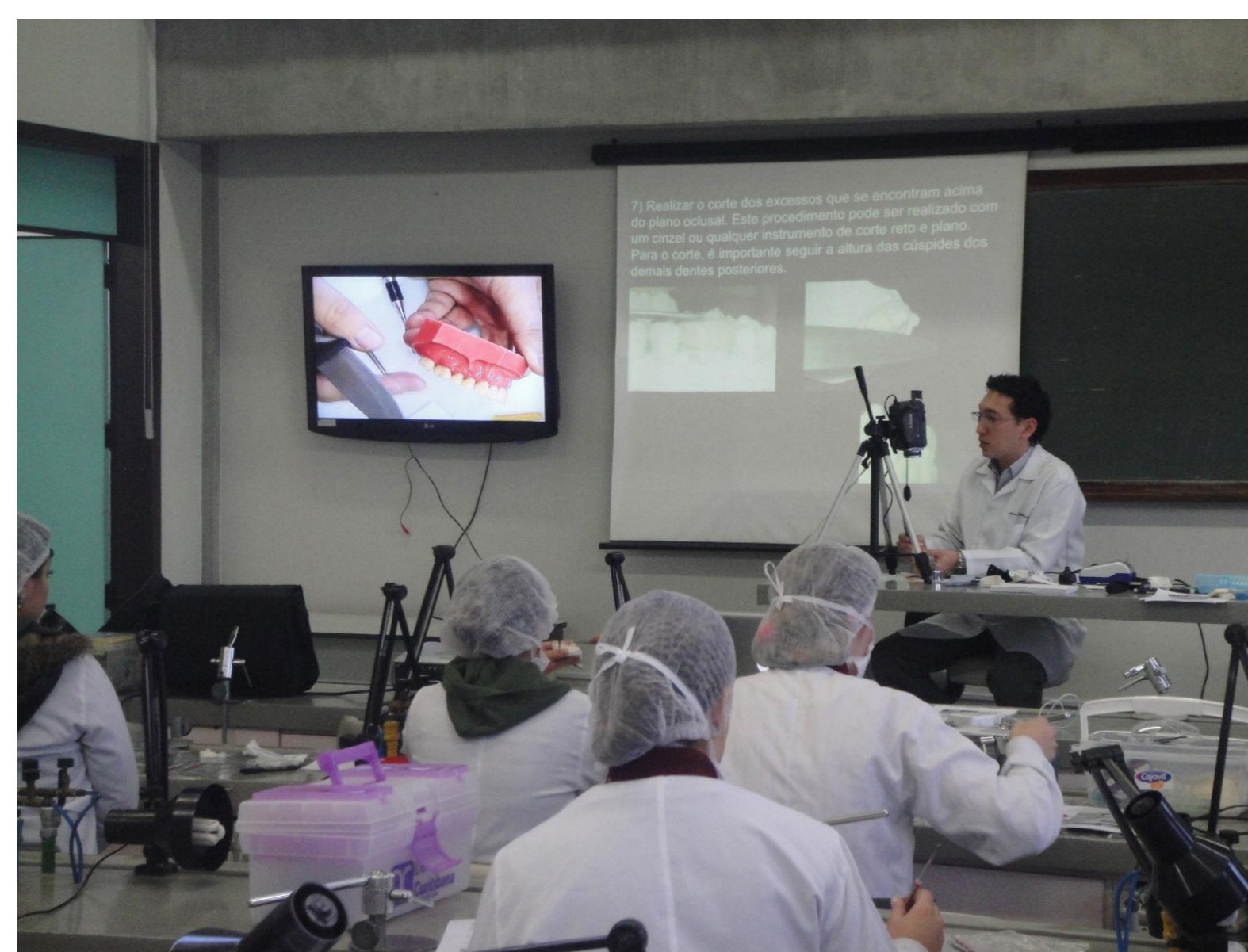
Figura 2. Laboratório de realização das oficinas