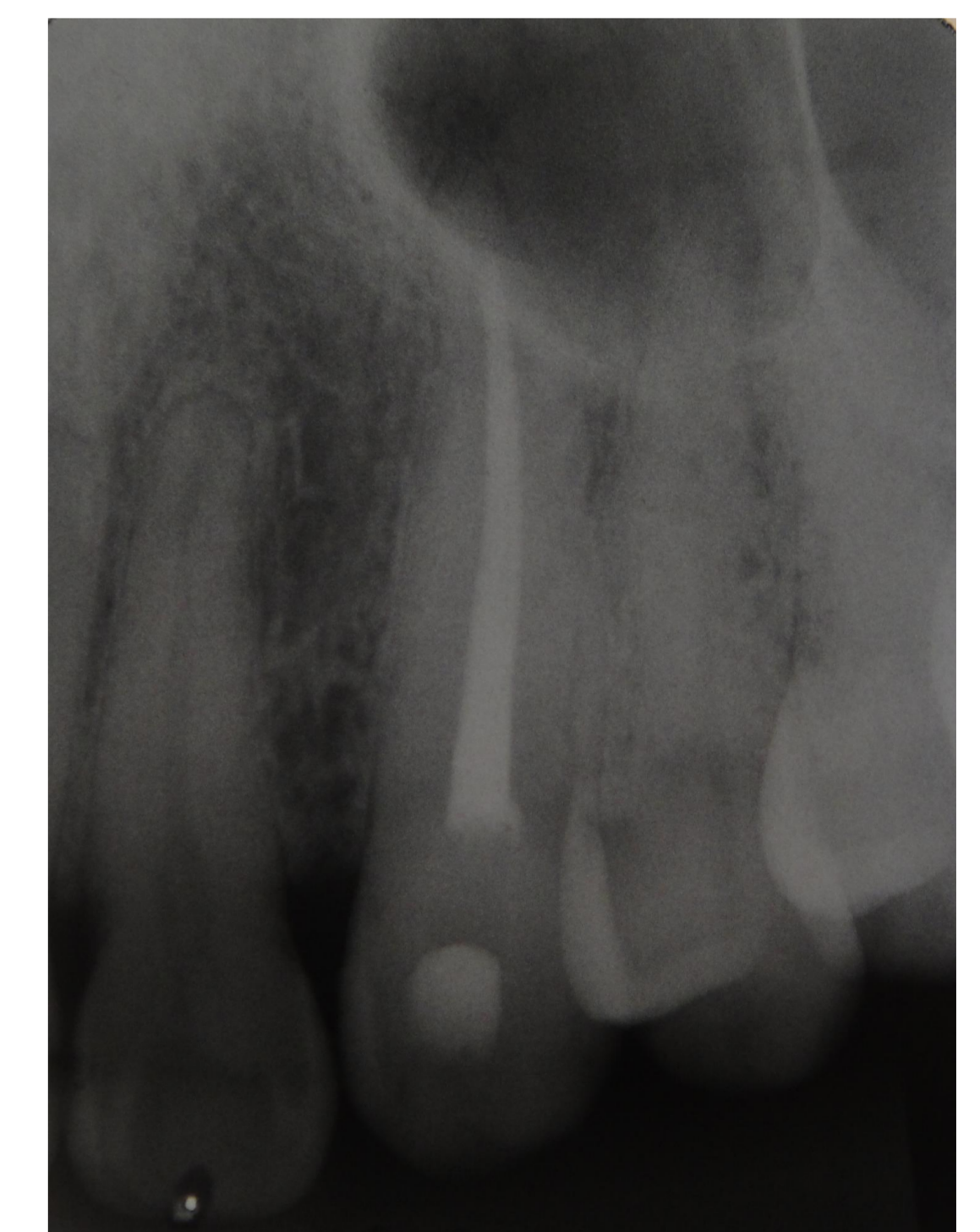
Figura 2 – Radiografia Inicial