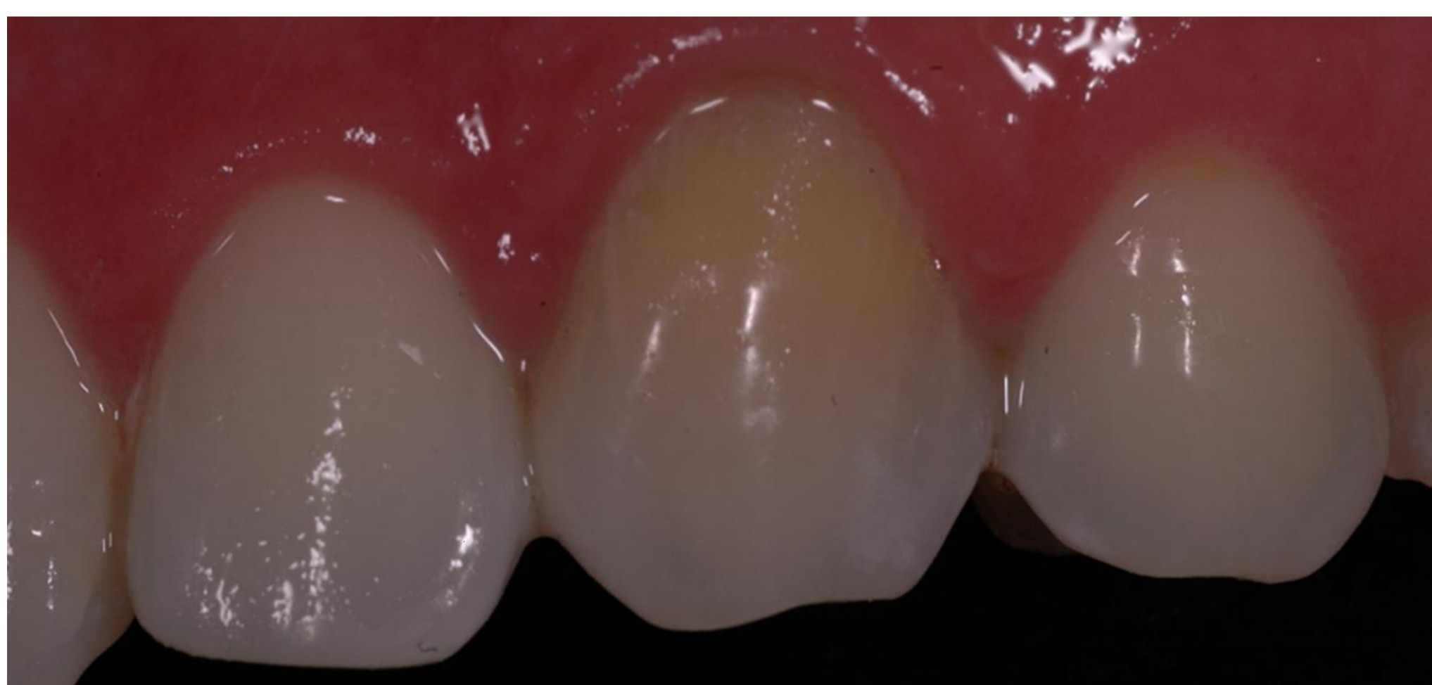
Figura 1 – Inicial

Paciente do sexo masculino, 27 anos. Com queixa de escurecimento no 23 antes do tratamento endodôntico.