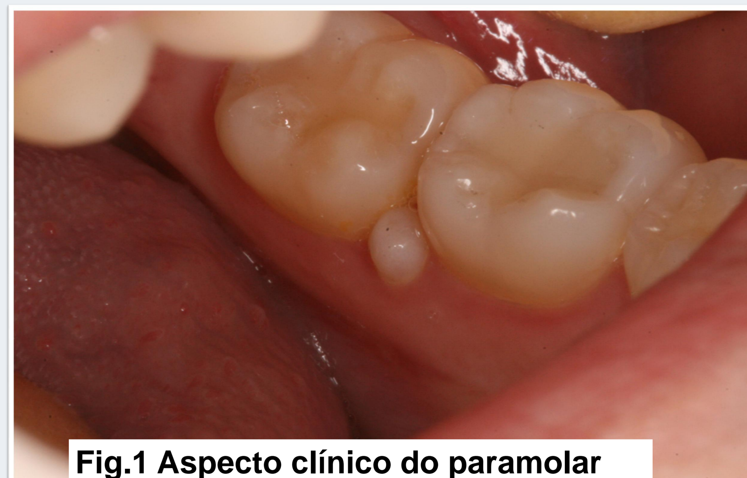
Fig.1 Aspecto clínico do paramolar

Paciente do sexo feminino, 22 anos de idade queixava-se da presença de uma estrutura pequena e endurecida entre os dentes inferiores ( Fig. 1). O exame clínico e os recursos de imagens revelaram a presença de um dente supranumerário localizado entre os dentes 46 e 47 cujo diagnóstico foi de um paramolar. A literatura revela que esta anomalia dentária é rara, principalmente entre o 1º e 2º molar mandibular. A paciente foi orientada a realizar a remoção cirúrgica, pois, o dente naquela localização poderia contribuir para a impactione alimentar.